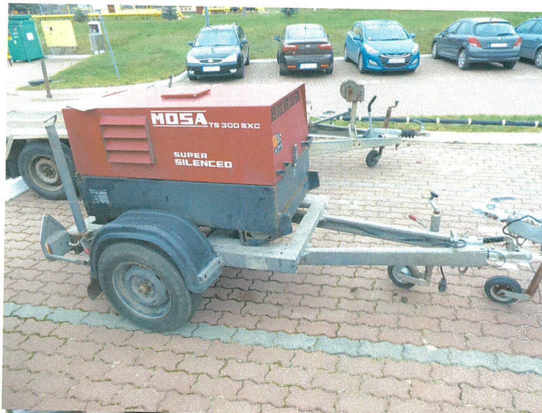
Pryczepa Stolorz, KT 17168